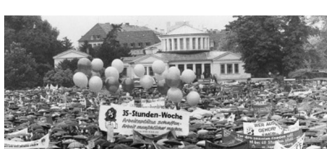
▲ 28.05.1984, Bonn. 250 000 ArbeitnehmerInnen demonstrieren, um der Forderung der streikenden Metallarbeiter Nachdruck zu verleihen.

1935 ILO, Konvention zur 40-Std. Woche 1936 FR, Gesetz zur 40-Std.-Woche 1938 USA, Fair Labor Standards Act etabliert die 40-Std.-Woche mit 5 Tagen á 8 Std. Arbeitszeit 1956 DE, »Samstags gehört Vati mir« DGB-Kampagne