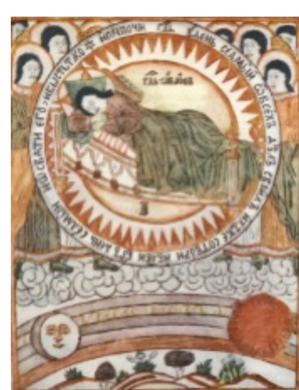
▶ Gott ruht am Schabbat, russische Bibelillustration 1696