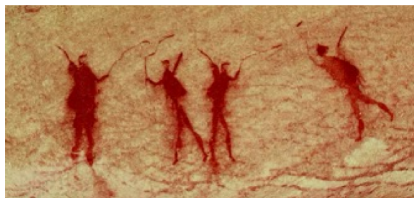
▲ Höhlenmalerei in den Zederbergen, Südafrika: Menschen bei der Jagd. San-Wildbeuter, ca. 1 000 bis 2 000 Jahre alte Zeichnung

Nachgewiesen sind besondere »Feiertage« mit wenig oder weitgehend ohne Arbeit auch schon für die WildbeuterInnen (»Feastings«), in den Agrikulturgesellschaften waren sie stark orientiert am Jahreskreis. In kapitalistischen Gesellschaften spiegeln sie eine Mischung aus historischen, religiösen, nationalstaatlichen und zunehmend kommerziellen Faktoren wider. Ihre Anzahl und Umfang sind variabel.