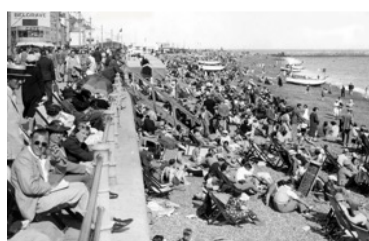
▲ Großbritannien, Sommer 1938: tausende Arbeiterfamilien genießen das erste Mal in ihrem Leben Urlaub am Strand.

Umsetzung einer Forderung der sozialdemokratischen Amsterdamer Gewerkschaftsinternationale