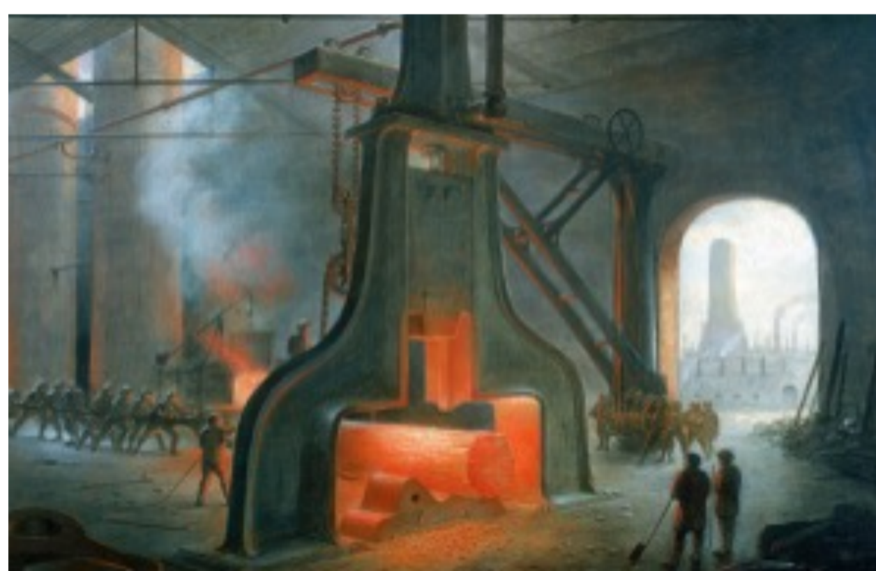
▲ Stahlhammer, Gießerei von James Nasmyth – Manchester, 1832.

1802 UK, First Factory Act: Im UK wird Kinderarbeit über 12 Stunden pro Tag schrittweise verboten (exkl. Pausen); ab 1833 gelten für Kinder unter dreizehn Jahren 8 Stunden als Maximum 1840er UK, Einführung des 12 Stunden-Tages für alle Frauen und Kinder unter 18 Jahren.